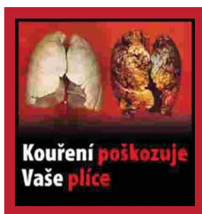
Obrázek 1. Příklad varování

Nejúčinnější prevencí jsou zákony, které nejenže stát nic nestojí, dokonce by na nich vydělal. Jsou to především vysoké daně a tím daná vysoká cena cigaret, dále zcela nekuřácké všechny uzavřené veřejné prostory včetně restaurací, naprostý zákaz jakékoli reklamy a marketingu tabákových výrobků včetně místa prodeje, cigarety by dokonce ani v trafice neměly být vidět, ale být zavřené v neprůhledné skříňce, kuřák si jen řekne, co chce. Samozřejmostí by měl být prodej jen ve specializovaném obchodě s licencí, tedy v trafice, a ne dohromady například s potravinami. Na krabičkách by měla být zdravotní varování s obrázkem, a to na více než 50 % plochy. Příklad našeho varování, které se týká dýchacích cest, je na obrázku 1.